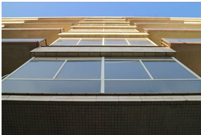
Perspektivní pohled na zimní zahrady středové sekce.