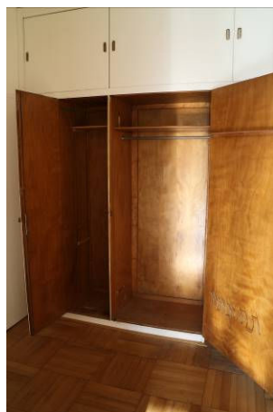
Původní vestavěná skříň v bytech.