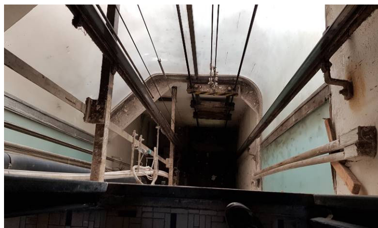
POHLED DO VÝTAHOVÉ ŠACHTY V.Č.3